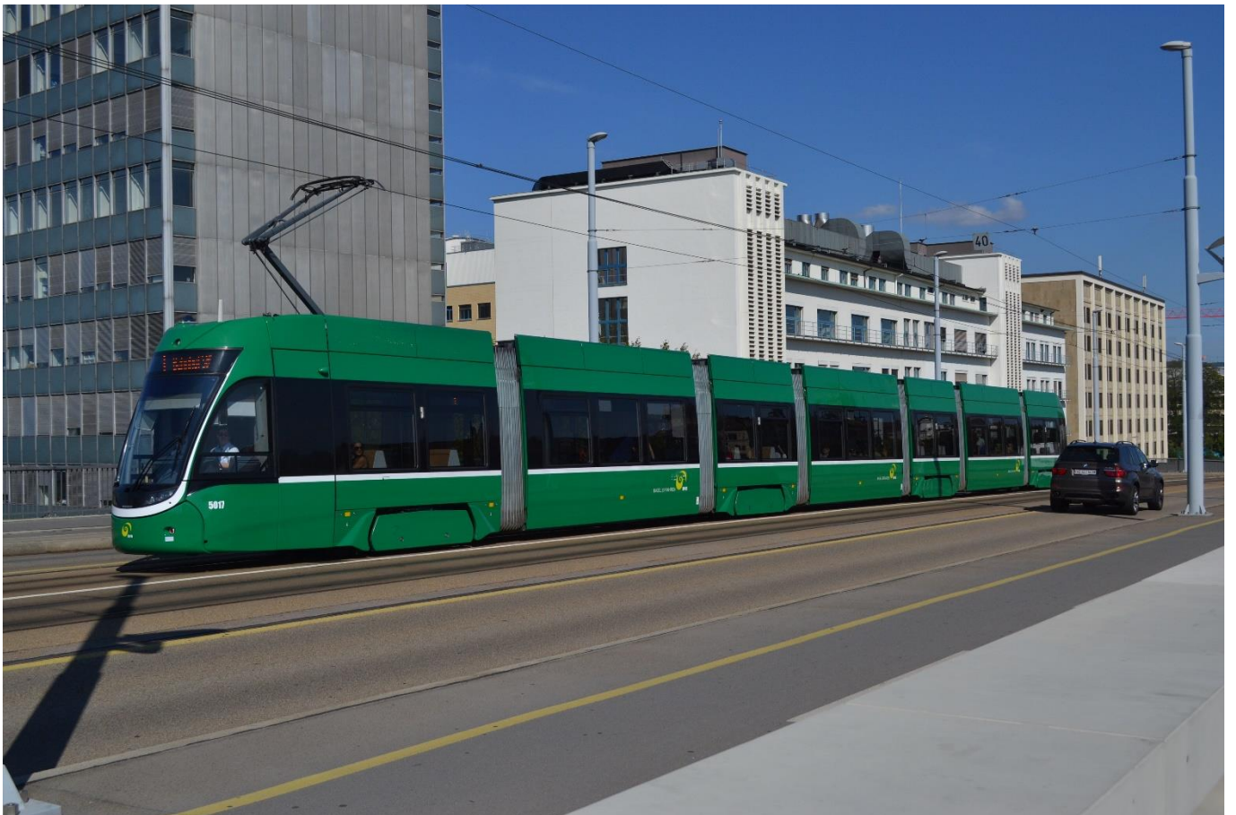
BVB „Bombardier Flexity“ (7-teilig)