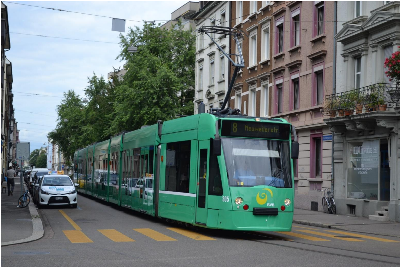
BVB „Siemens Combino“